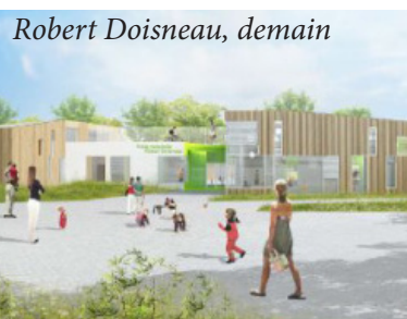
Robert Doisneau, demain

>> Projet Éducatif Local - 02 51 81 87 61