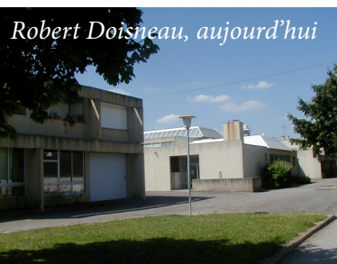
Robert Doisneau, aujourd'hui

L'accueil périscolaire et l'école Robert Doisneau élémentaire ont un projet commun sur l'histoire de l'école, mais aussi du quartier de Gesvrine en général.