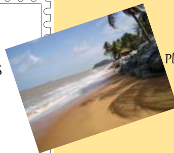
Plage de Guyane