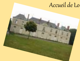
Accueil de Loisirs