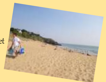
Plage de Pornichet